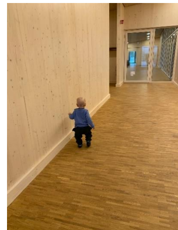
Weg zum Bistro