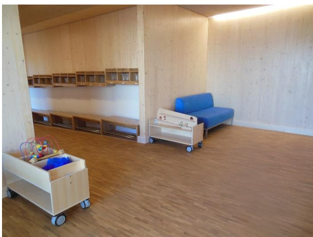
Spielbereiche im Flur